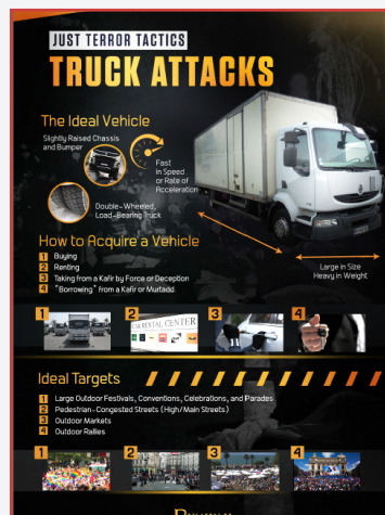
Revue de propagande de l'EI publiée en mai 2017

Les véhicules peuvent être de toutes natures : légers ou lourds et en particulier des utilitaires, des véhicules de transport de matières dangereuses, des bennes de collecte des ordures ménagères ou même des véhicules de chantier. Ces véhicules peuvent être volés sur leur lieu de parking habituel ou sur leur trajet après une agression du conducteur.