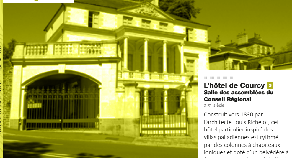
Hôtel de Courcy