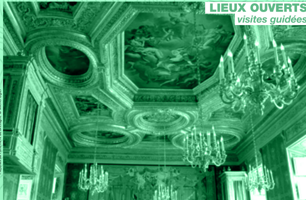
Plafonds du Parlement de Bretagne

Organisé par Agrocampus Ouest et le service Rennes Métropole d'art et d'histoire - Destination Rennes - Office de Tourisme