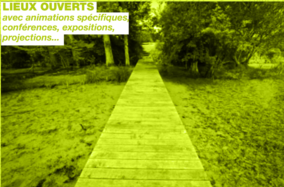
Parc de la Morinais à Saint-Jacques-de-la-Lande