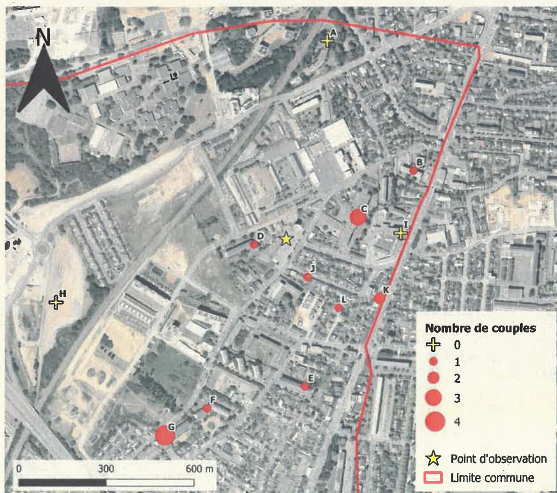
Carte 2 : Localisation des goélands argentés nicheurs sur le quartier du Pigeon-Blanc en 2020.