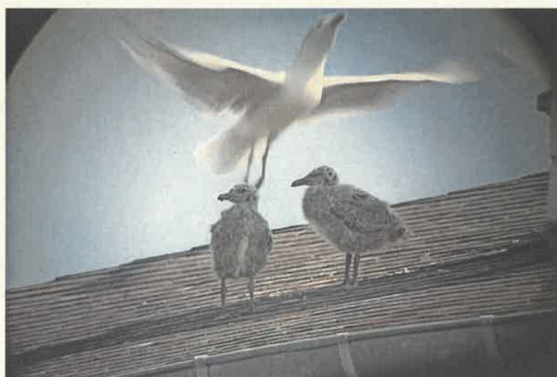
Figure 2. Poussins quémendant de la nourriture à un adulte proche au 71-75 rue de la Pilate.