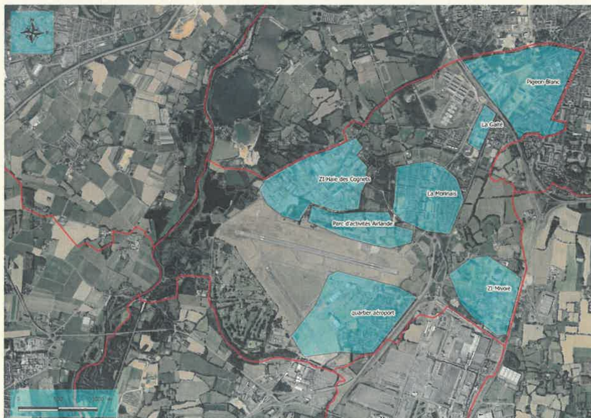
Carte 1 : Localisation des secteurs recensés (selon Morel 2016).