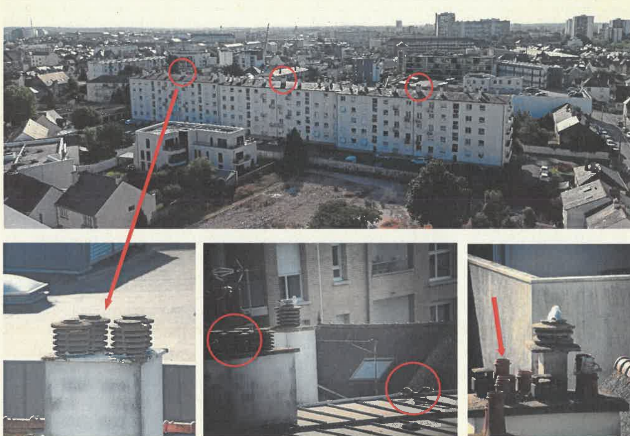
Figure 1. Exemples d'emplacements de nids de goéland argenté photographiés sur les toits du quartier du Pigeon-Blanc au printemps 2020 (en haut, l'immeuble du 16-20 rue Gabriel Péri et en bas de gauche à droite : 16-20 rue Gabriel Péri ; 248 rue de Nantes ; 6 impasse de la sablonnière).