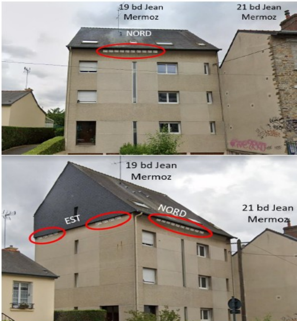
Figure 23 : Proposition d'installation de nichoirs sur les façades est et nord du 19 bd Jean Mermoz

Emplacement prévisionnel des nichoirs temporaires de compensation