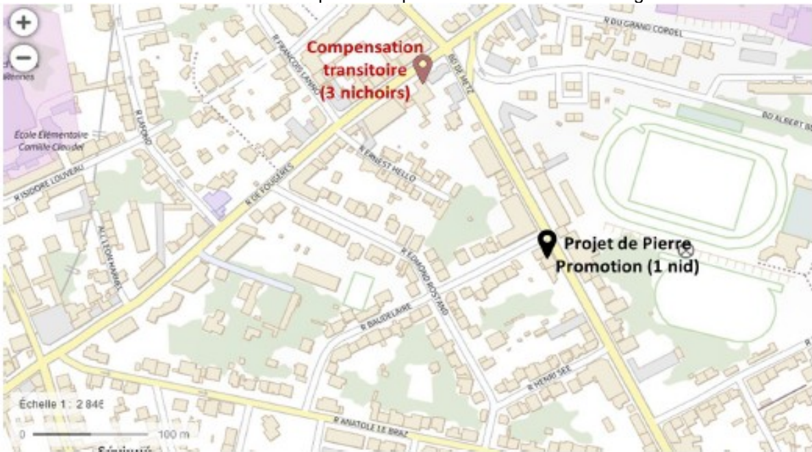
Localisation des 3 nichoirs en compensation provisoire à proximité du projet de Pierre Promotion

Localisation de la compensation provisoire au 120 rue de Fougères