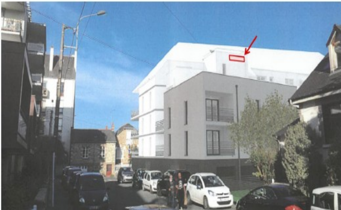
Localisation du nichoir intégré dans la façade Ouest du bâtiment de Pierre Promotion