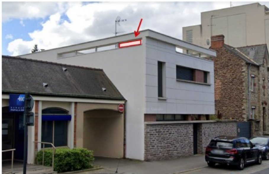
Localisation des 3 nichoirs sur la façade Est du 120 rue de Fougères