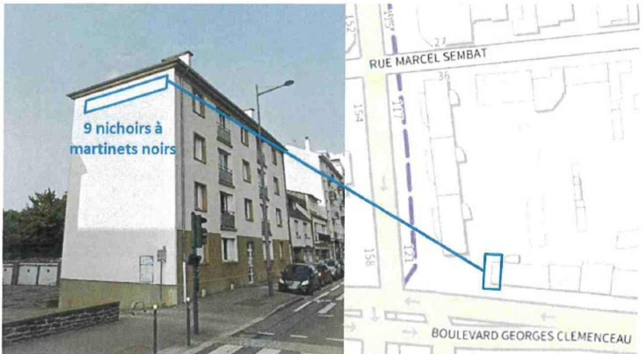
Localisation des nichoirs de Martinet noir au 103 Boulevard Georges Clémenceau