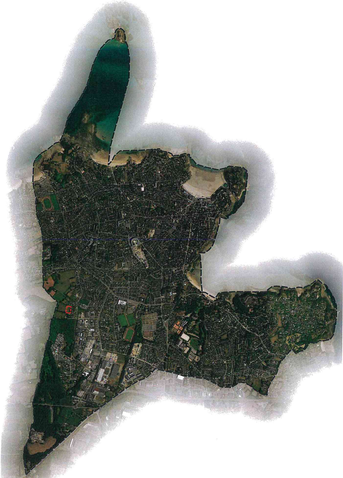
Localisation du projet à l'échelle communale :